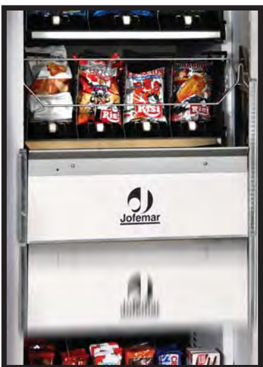
Ascensor de entrega de producto Product Giver Elevator