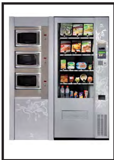
Opción de control para modulo de microondas Microwaves tower controlled by a Vision machine