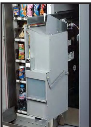
Estructura modular con elementos extraíbles Modular structure with Extractable elements